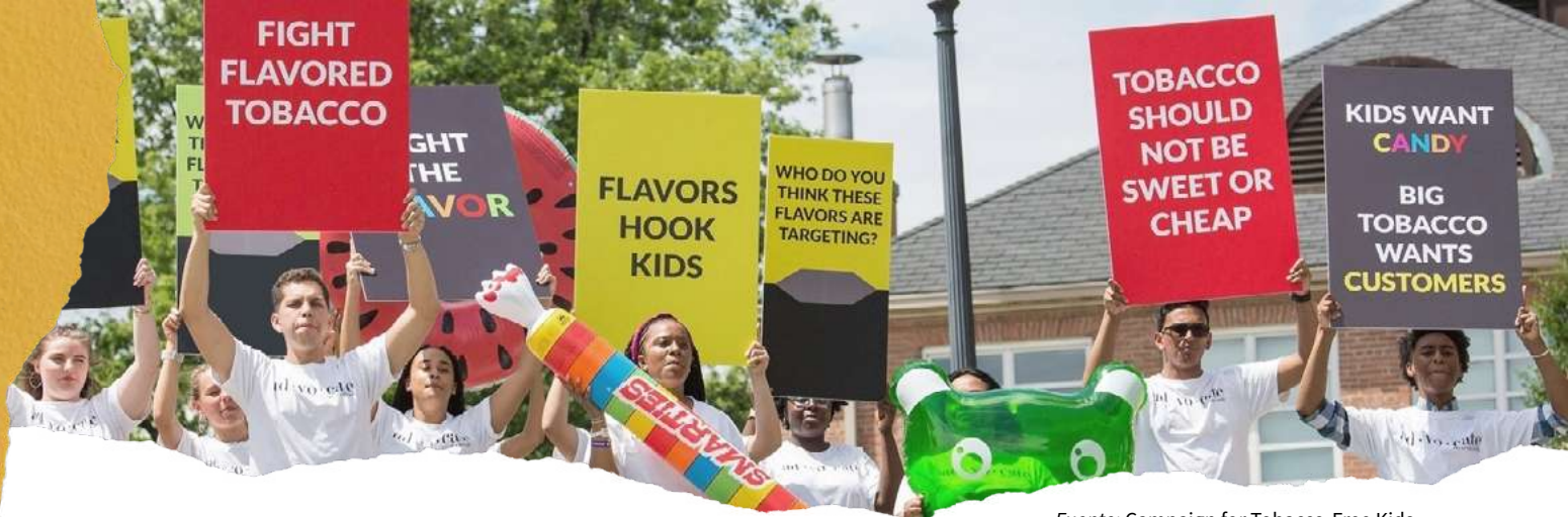
Fuente: Campaign for Tobacco-Free Kids.