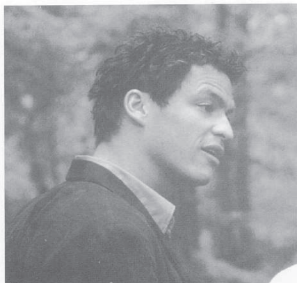
JASPER: Dominic West.