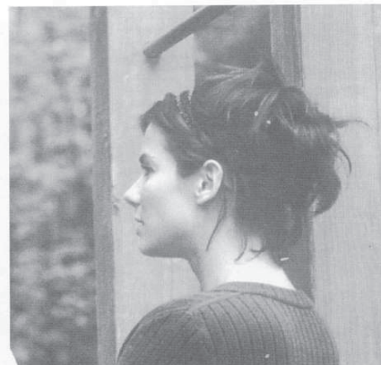
GWEN CUMMINGS: Sandra Bullock.