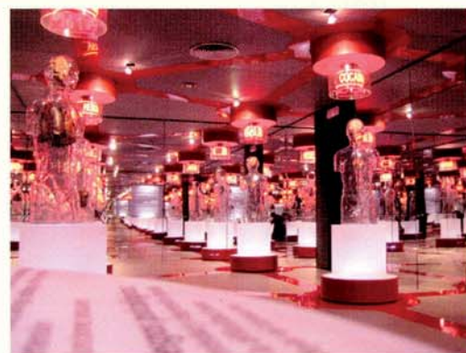
El punto en común de las drogas es que reactivan los circuitos de recompensa que actúan en el cerebro.

Al final de la conferencia se abrió un turno de preguntas en el que los universitarios se mostraron muy participativos con temas como los tratamientos con metadona, drogas menos extendidas como la ketamina o la utilidad del cannabis de forma médica.